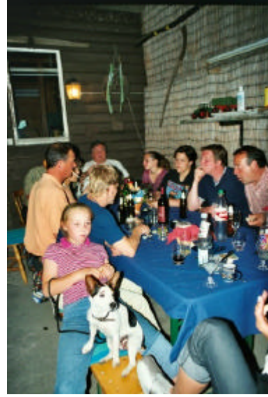
Beim Abendessen ...